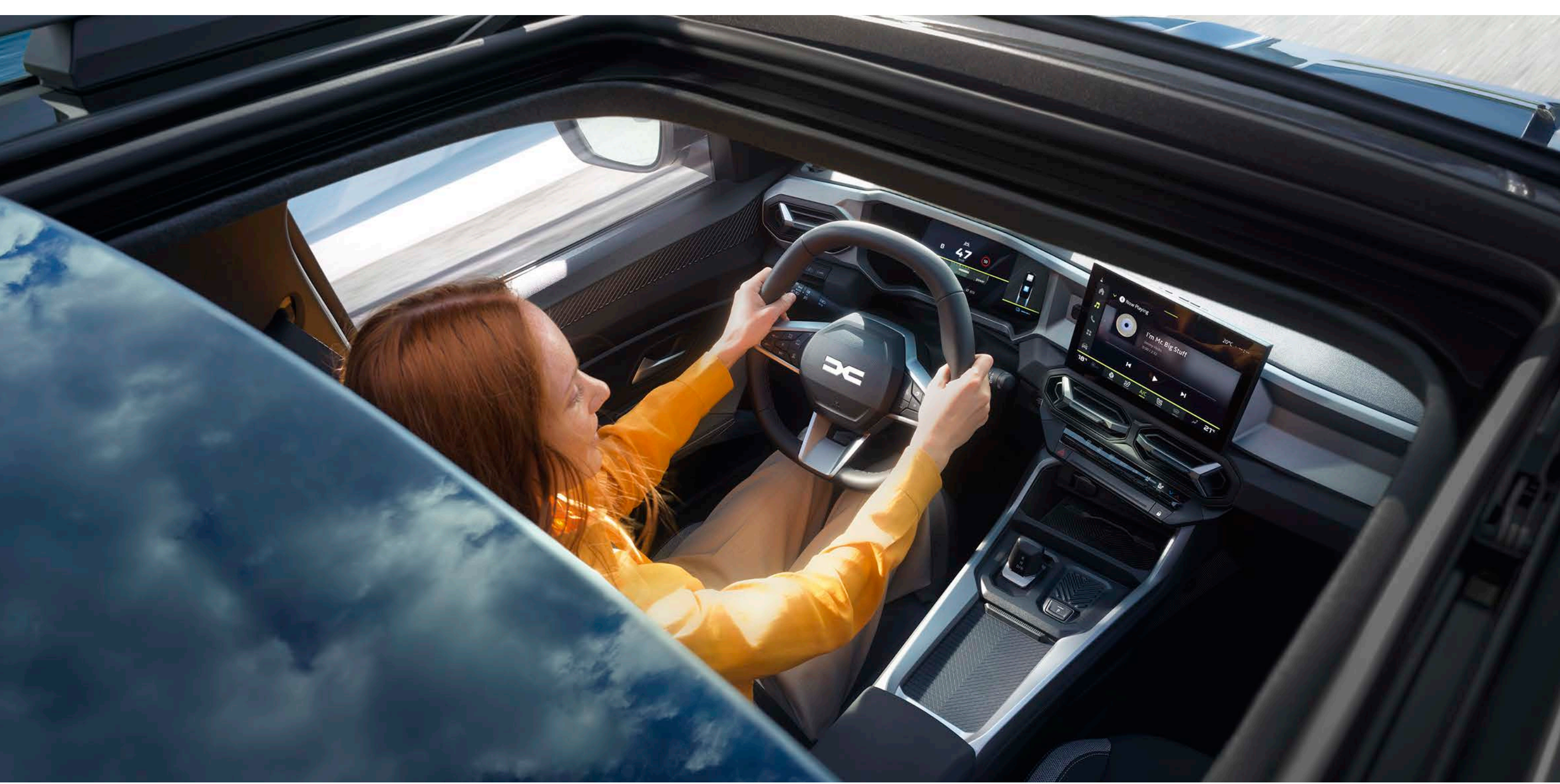
Elektromosan nyitható panoráma üvegtető

A kéttónusú fényezés nyugodt eleganciát áraszt, a nyitható panoráma üvegtetővel a belső tér fényárban úszik, az egyedi Indigókék metálfényezés pedig még különlegesebbé teszi az autó megjelenését. Mindenki számára van egy Bigster!