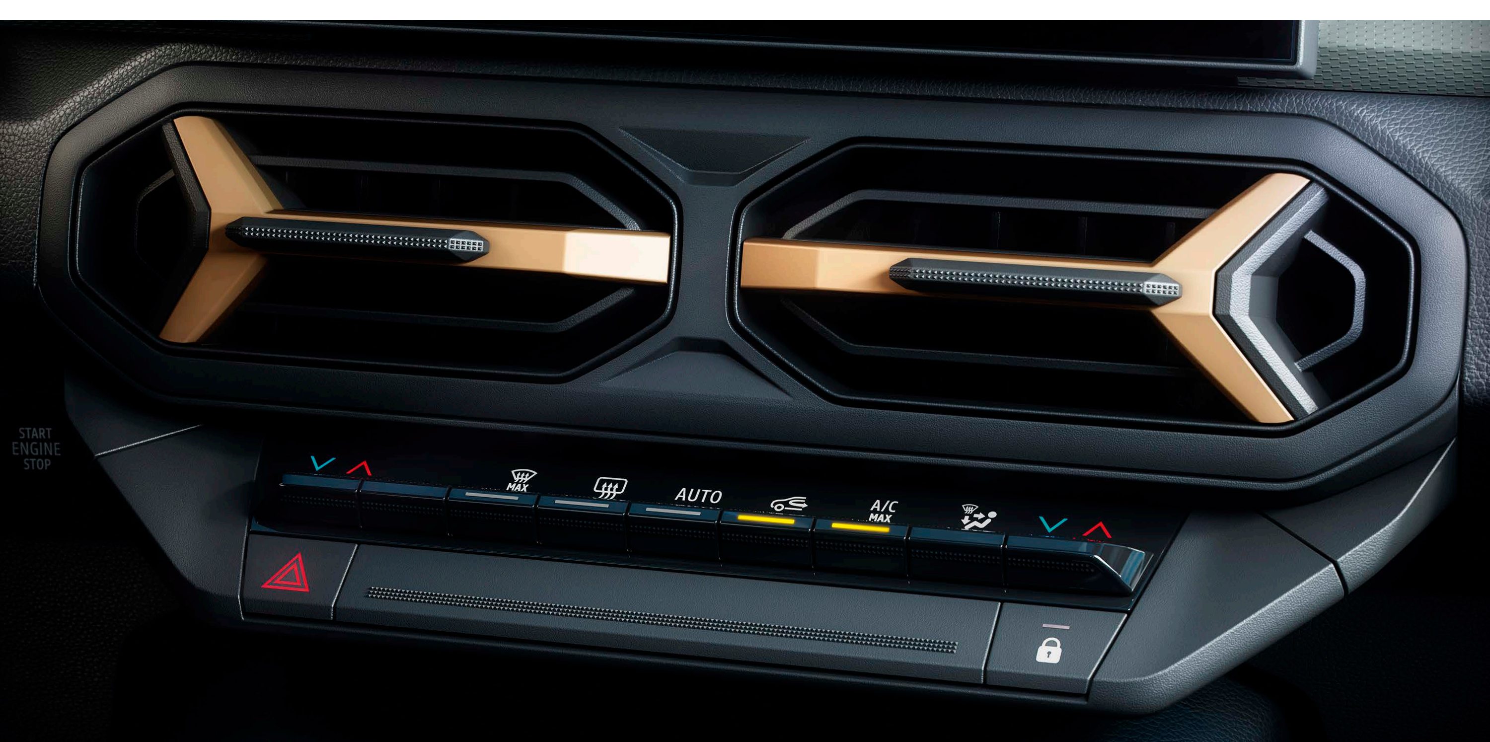
Kétfónás automata klímaberendezés

Az öt utas még nagyobb kényelme érdekében kialakított belső tér hangszigeteléssel, hat hangszóróval ellátott Arkamys® 3D hangrendszerrel, valamint személyre szabható, kétfónás automata légkondicionálóval és hátsó utastéri légbeömlőkkel is rendelkezik.