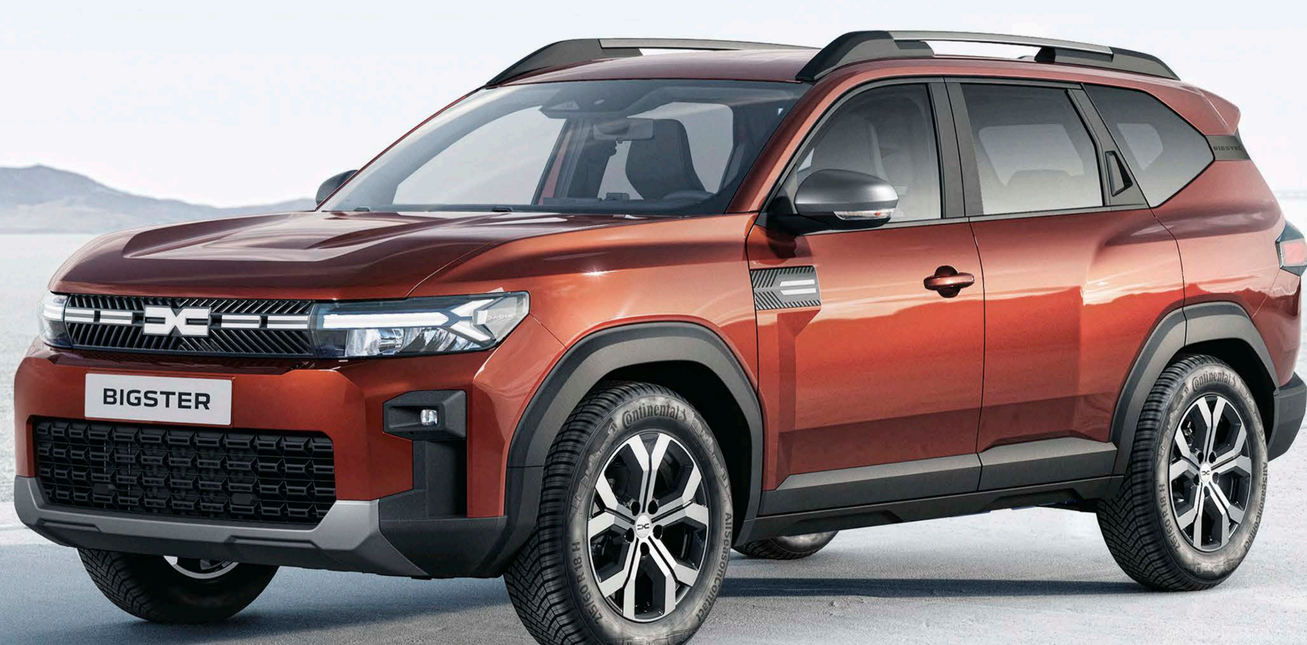
TERRAKOTTA BARNA (2)

(1) Nem metálfényezés. (2) Metálfényezés. A képek csak illusztrációk, a színek eltérhetnek a valóságban.