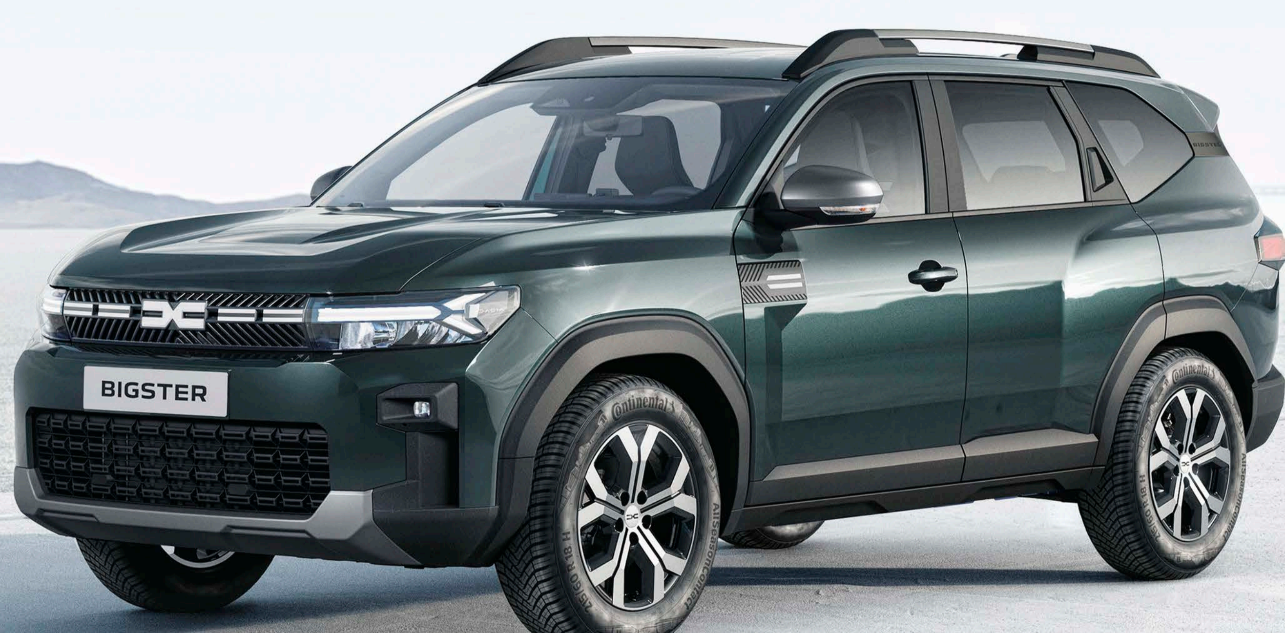
CÉDRUS ZÖLD (2)