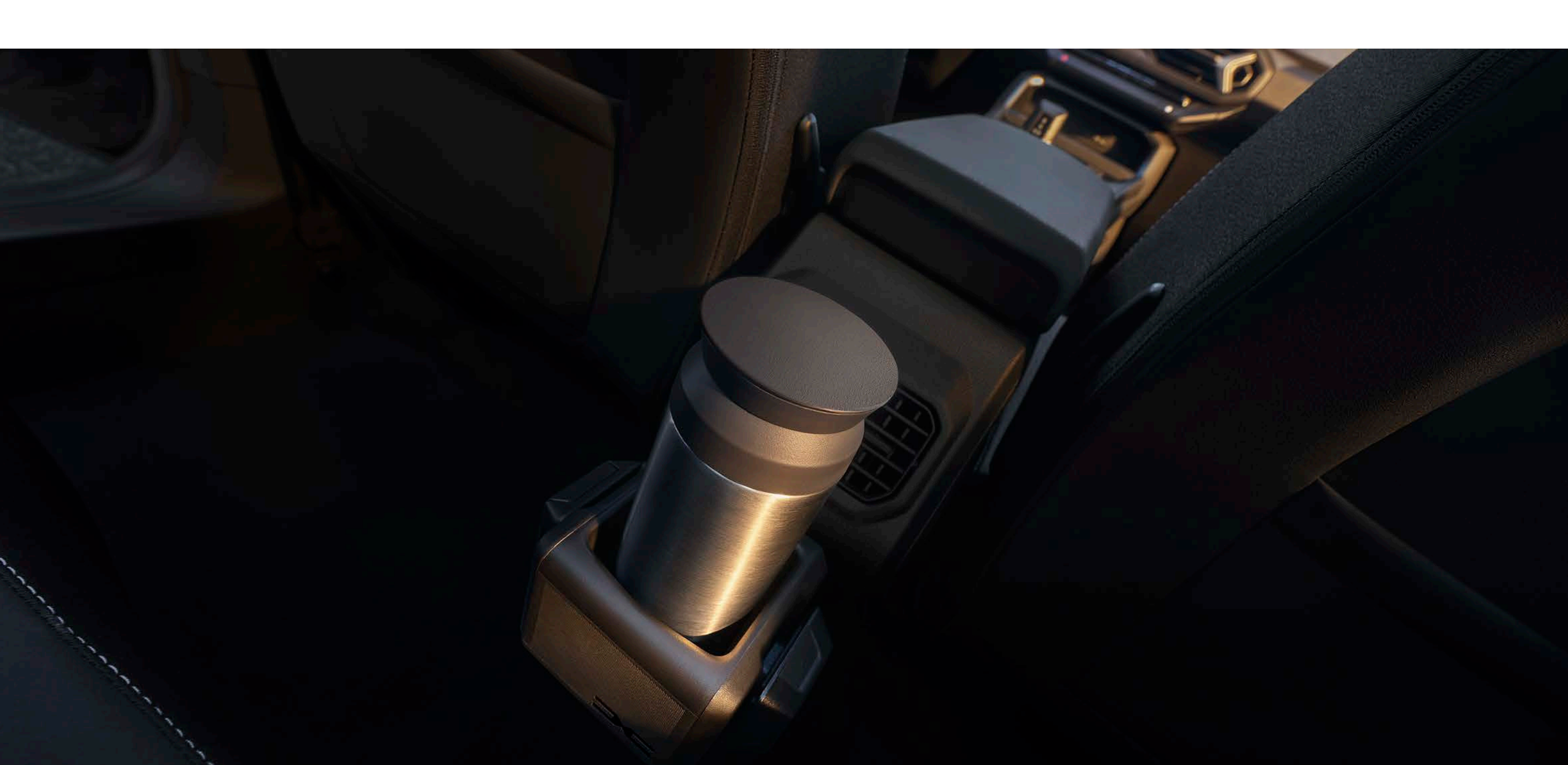
YouClip 3in1 tartozék (pohár nélkül)