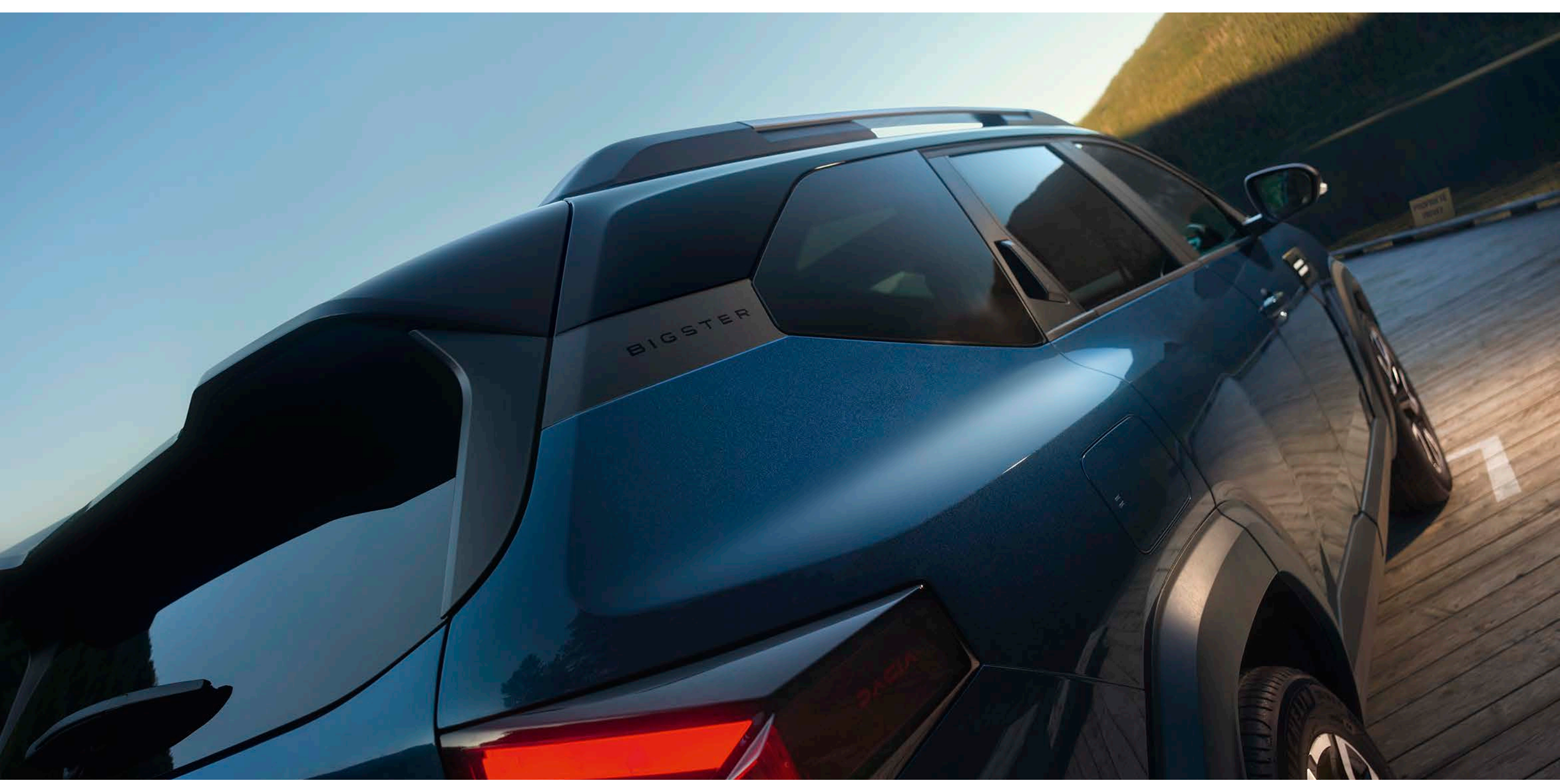
Egyedi kéttónusú fényezés