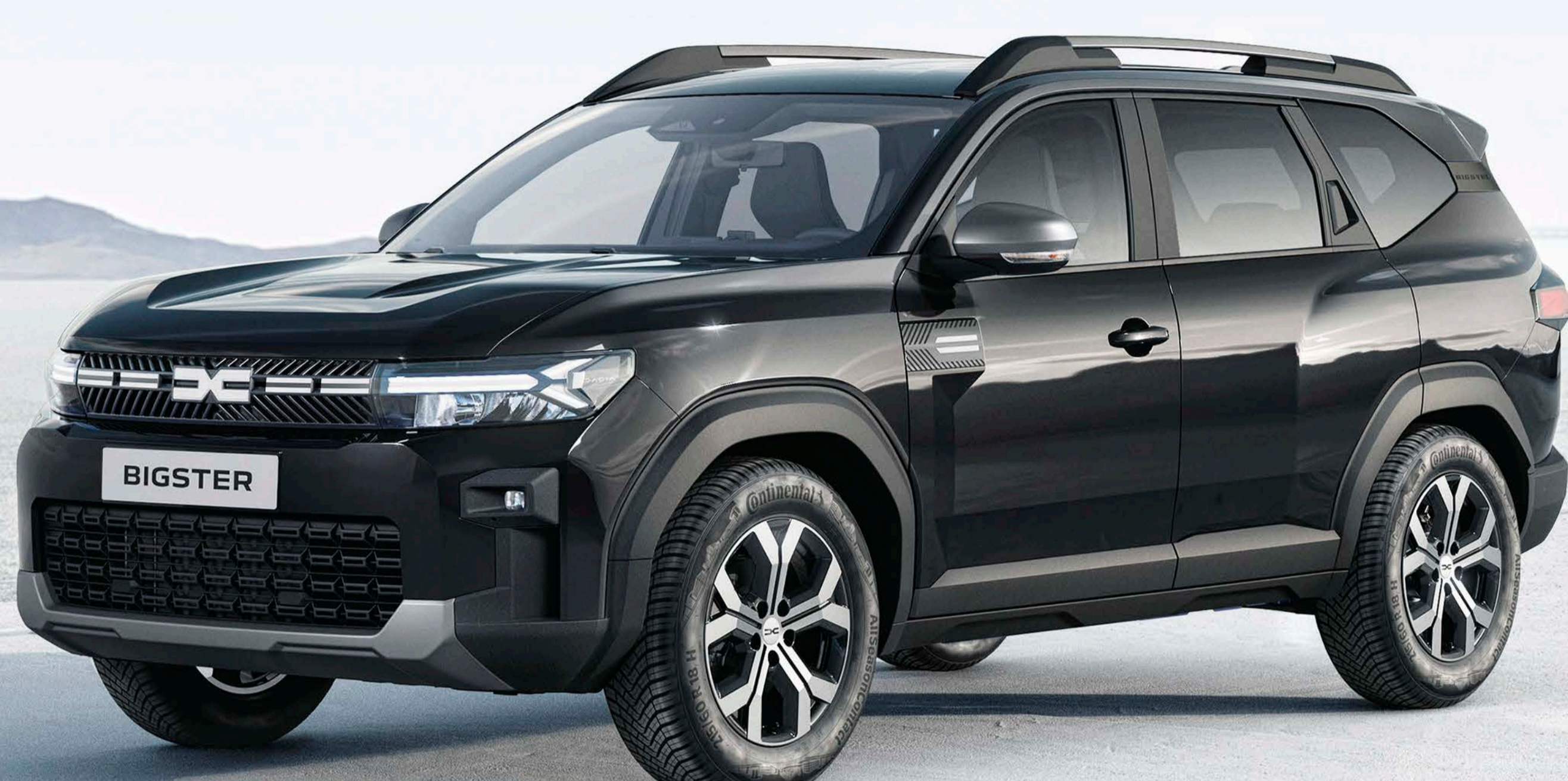
FEKETE GYÉMÁNT (2)